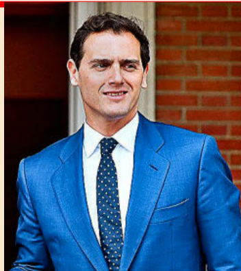
Albert Rivera, presidente del bufete Martínez-Echevarría y Rivera.