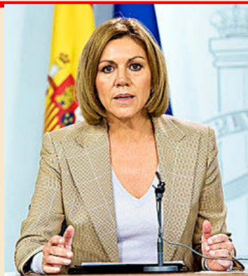
María Dolores de Cospedal, socia de procesal y arbitraje de CMS Albiñana & Suárez de Lezo.

2020 empezó con dos fichajes de altura. María Dolores de Cospedal, ex secretaria general del PP, se unió a CMS, mientras que quien fuera el líder de Ciudadanos, Albert Rivera, fue nombrado presidente de Martínez-Echevarría. Aunque el ritmo descendió, la pandemia no acabó con el mercado de fichajes.